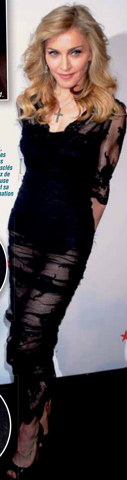
Madonna, 54 ans. Les bras et les pieds musclés et veineux de la chanteuse trahissent sa consommation de HGH.

A Los Angeles, tout est business, et l'anti-âge en est un super-gros. Pour rester dans la force de la jeunesse, les stars ne reculent devant rien. Et se croient invincibles. Faudrait-il que l'une d'elles paie au prix fort ce genre de folie pour que les autres changent de comportement ? En attendant, à Hollywood, les obsédés de l'apparence continuent à se piquer le ventre et à se regarder le nombril. ■