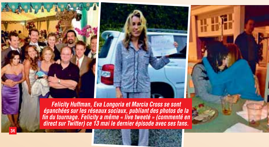
Felicity Huffman, Eva Longoria et Marcia Cross se sont épanchées sur les réseaux sociaux, publiant des photos de la fin du tournage. Felicity a même « live tweeté » (commenté en direct sur Twitter) ce 13 mai le dernier épisode avec ses fans.

Nous, ce que l'on peut vous révéler, c'est que des réponses sont apportées aux questions laissées en suspens au terme de la saison 7. A l'issue de l'avant-dernier épisode, on sait si Carlos est condamné ou non pour le meurtre d'Alejandro, le beau-père de Gaby. Quant à Lynette et Tom, ils divorcent pour de bon ou se remettent ensemble... pour de bon. Mais, chut! Pour le reste, sachez que Dana Delany, alias Katherine Mayfair, fait une apparition dans l'ultime épisode, tout comme plusieurs « morts » de la série. Le plus célèbre est évidemment Mary Alice (incarnée par Brenda Strong), celle par qui tout a commencé. « Elle expliquera ce qu'elle a fait après son décès et pourquoi elle a continué à veiller sur ses amies », a expliqué Marc Cherry. Avant que le rideau tombe définitivement sur les mésaventures de Lynette, Susan, Gaby et Bree, vous les verrez aussi danser. Et vous les verrez dans leur futur. Vous serez tristes, mais rassurés. Et verserez, à coup sûr, votre petite larme. « Desperate Housewives », c'est fini, mais qu'est-ce que c'était bien! ■