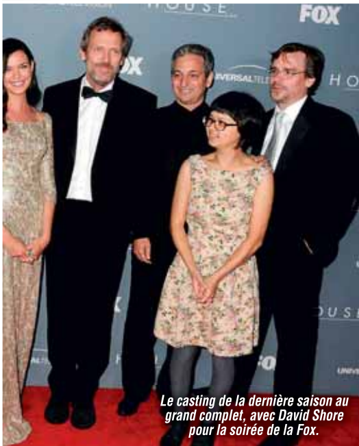
Le casting de la dernière saison au grand complet, avec David Shore pour la soirée de la Fox.